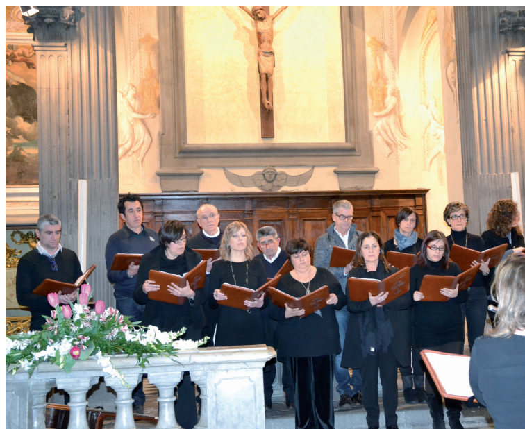
il coro parrocchiale a Santa Maria a Monte.

Una vera e propria grazia avere ogni domenica l'animazione liturgica festiva nella nostra parrocchia.