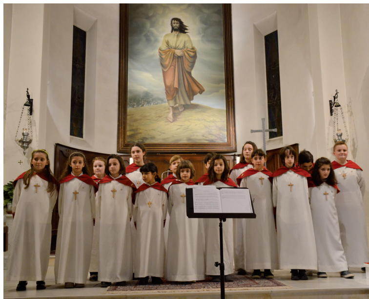
i Pueri Cantores si sono esibiti alla prima serata della rassegna svoltasi a Capanne.